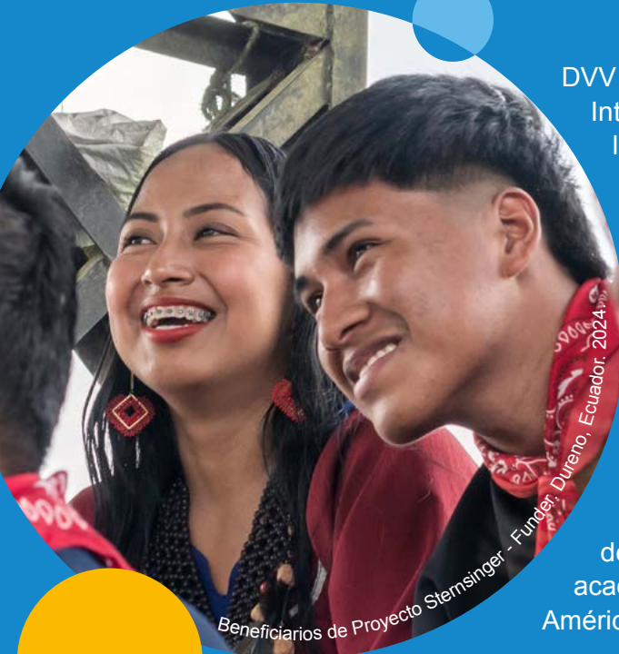
Beneficiarios de Proyecto Sternsinger - Funder: Dureno, Ecuador, 2024

DVV International es el Instituto de Cooperación Internacional de la Asociación Alemana para la Educación de Adultos, el mayor proveedor de educación continua en Alemania, a través de sus más de 850 centros de educación de adultos y universidades populares (Volkshochschulen o VHS).