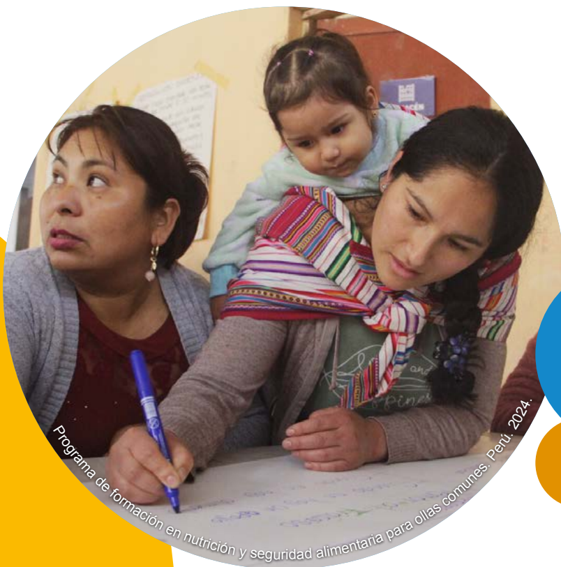
Programa de formación en nutrición y seguridad alimentaria para olas comunes, Perú, 2024.

A nivel meso , buscamos el fortalecimiento de estructuras y capacidades de actores relevantes en el ecosistema de educación y contribuimos a la profesionalización de educadores del sector formal y no-formal a través de currículos y el trabajo en redes docentes. Para lo cual, unimos esfuerzos con gobiernos locales, redes y organizaciones de la sociedad civil, plataformas ciudadanas, ONG, profesionales, docentes, educadores populares, academia y Estado.