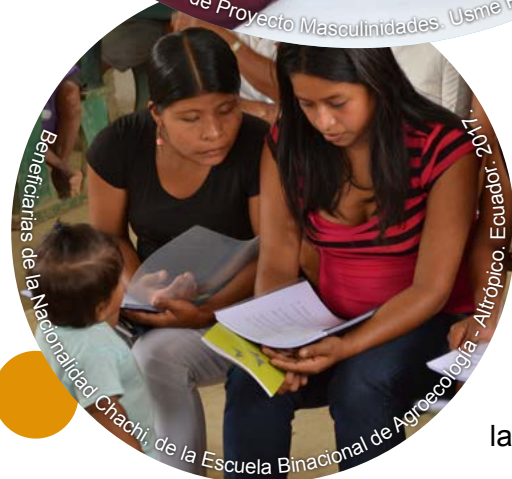
Beneficiarias de la Nacionalidad Chachi, de la Escuela Binacional de Agroecología - Altrópico, Ecuador, 2017.

• Apoyo para la representación de la sociedad civil y su vocería en conferencias del más alto nivel como la Conferencia Internacional de Educación de Adultos (Confintea VII), convocada por la UNESCO, así como en la Comisión de la Condición Jurídica y Social de la Mujer (CSW67) de la ONU.