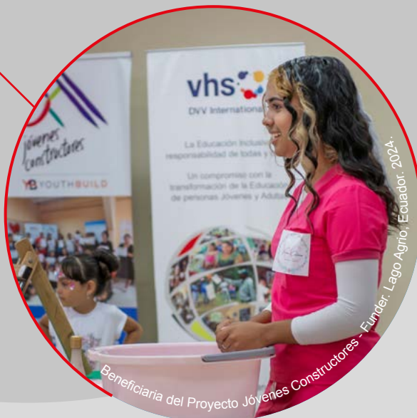
Beneficiaria del Proyecto Jóvenes Constructores - Funder: Lago Agrio, Ecuador. 2024.