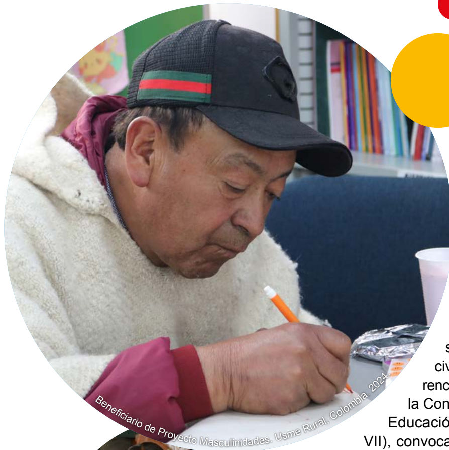
Beneficiario de Proyecto Masculinidades, Usme Rural, Colombia, 2024.