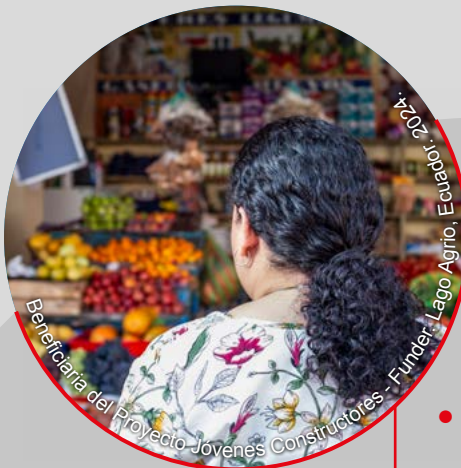
Beneficiaria del Proyecto Jóvenes Constructores - Funder: Lago Agrio, Ecuador. 2024.