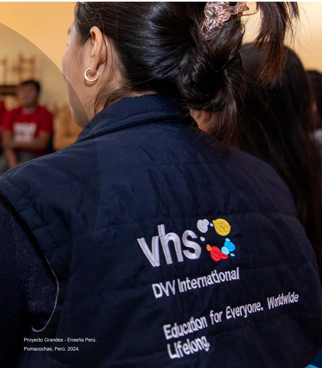
Proyecto Grandes - Enseña Perú. Pomacochas, Perú. 2024.